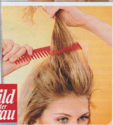
Bild der Frau EXTRA