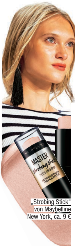
„Strobing Stick“ von Maybelline New York, ca. 9 €

„Viva La Vida“ lautete das Motto der Laurèl-Show. Entsprechend lebensfroh schminkte Boris Entrup den Models rote Lippen und einen strahlenden Sommer-teint. Wichtigstes Tool: Highlighter. In Stick-Form lässt er sich besonders einfach auftragen. Auf die höchsten Punkte im Gesicht, also Wangenknochen, Nasenrücken und Brauenbogen geben, mit dem Finger verblenden – und strahlen.