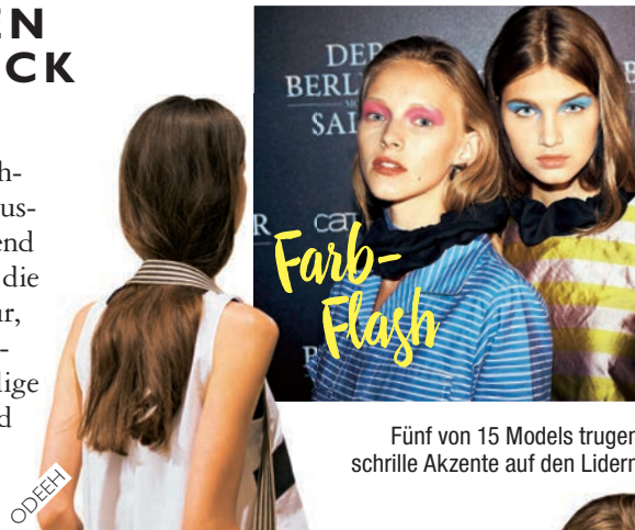
Fünf von 15 Models trugen schrille Akzente auf den Lidern

Eigentlich sollte das Make-up bei der Odeeh-Show minimalistisch ausfallen. Doch einen Abend zuvor entschieden sich die Stylisten und Loni Baur, Make-up Artist für Catrice, spontan für knallige Augenlider in Blau und Pink. Gut so!